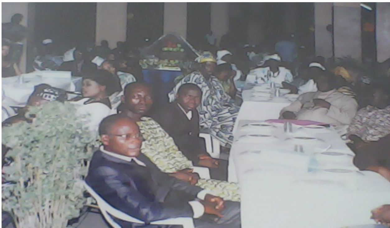
Nuit des OSC 2010

Toutes ces activités ont été réalisées avec le concours et le précieux appui de structures partenaires du Centre et des sponsors qui sont : l'ORTB, l'ONG VECO WEST AFRICA, la Maison de la Société Civile, les Délices d'Andréas, la Fondation AJAVON Sébastien Germain, le CNCB, l'ONG Nature Tropicale, l'ONASA, le Ministère de l'Agriculture, la SONAPRA, la SOBEBRA, le groupe CDPA-Agrisatch, la LNB, le Ministère de la Famille, la Maison de l'Entreprise du Bénin.