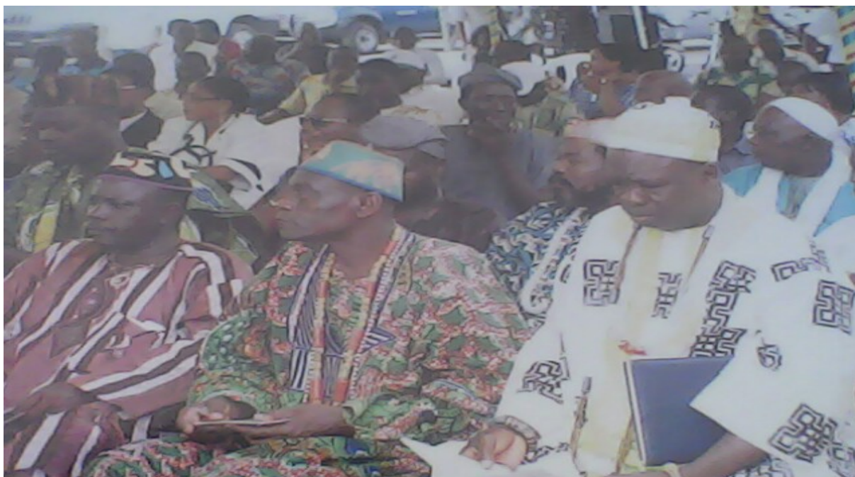
La délégation des rois et sages au lancement officiel