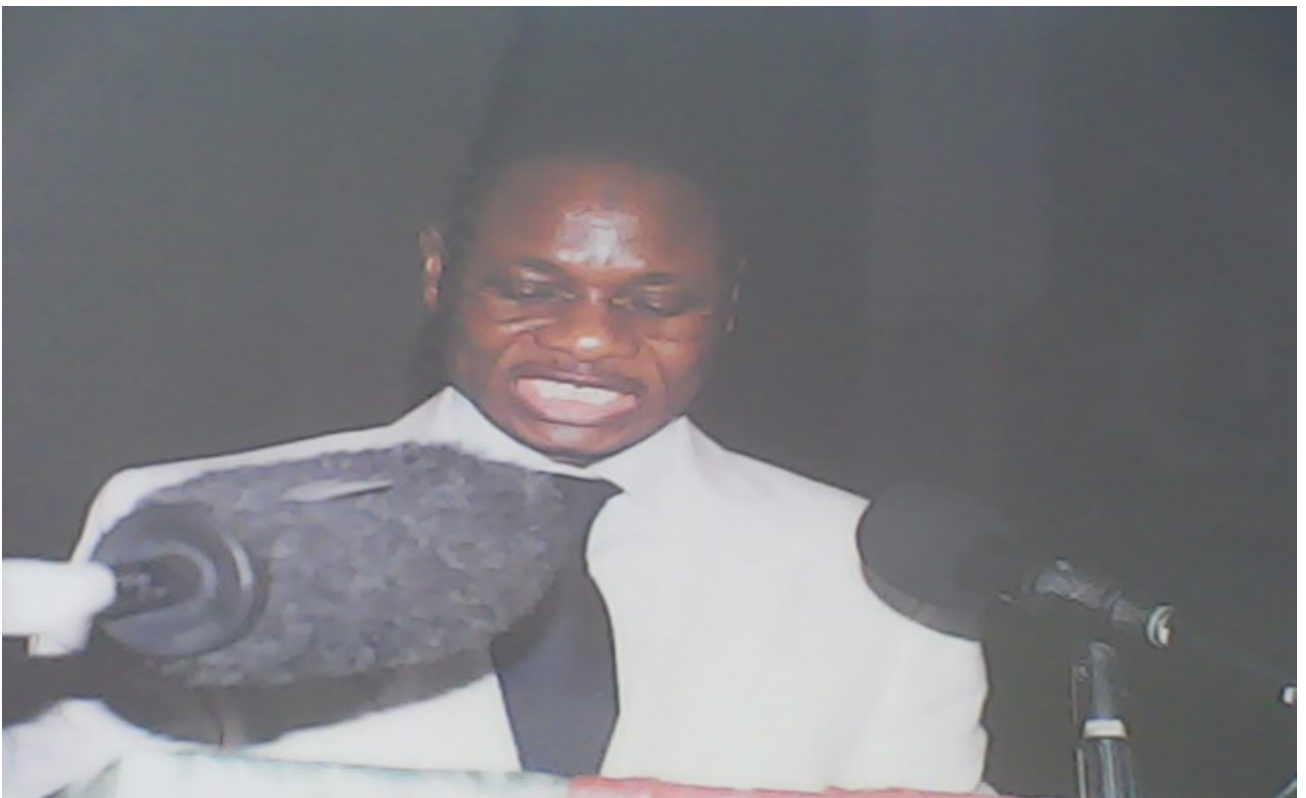
Nuit des OSC : Discours de clôture officielle des JOSCS 2010 par le Ministre Chargé des Relations avec les Institutions.

L'édition 2010 de la Nuit des OSC a été présidée par le Ministre Chargé des relations avec les Institutions et a permis de récompenser les quatre meilleurs participants aux JOSCS. La cérémonie a connu l'intervention des personnalités telles que le Directeur Général du Centre de Promotion de la Société Civile, le représentant des OSC, le Recteur de l'Université Africaine de Développement Coopératif, et le Directeur de la Maison de la Société Civile. Le dîner offert au cours de la soirée était exclusivement composé de mets locaux. En effet, le Centre a saisi l'occasion pour sensibiliser les invités sur l'utilité de la consommation locale et leur faire découvrir la richesse de la gastronomie béninoise.