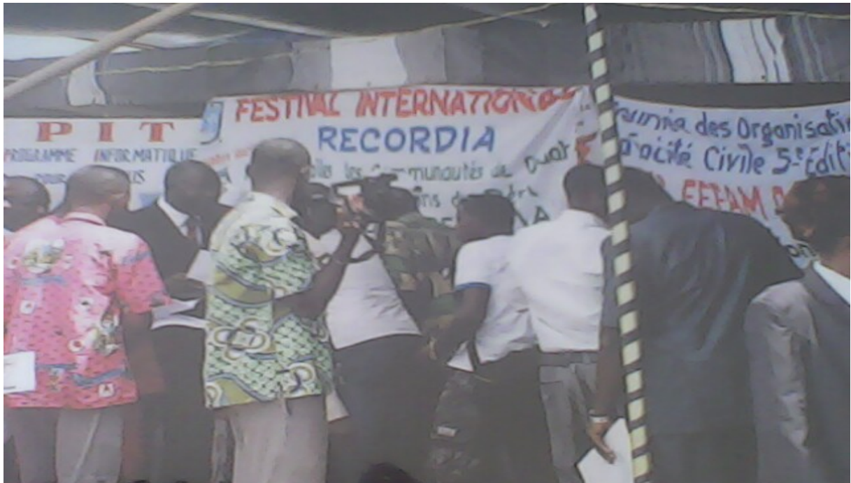
La visite des stands par les officiels

Il s'agit de l'activité qui permet de démontrer au public l'ingéniosité et le combat de la société civile pour le développement. Elle a connu la participation de cinquante deux organisations venues de tous les Départements du Bénin, contre trente neuf en 2009. Les domaines d'intervention représentés sont : l'Environnement et la protection de la nature, l'agroalimentaire, la santé, la pharmacopée, la promotion de la culture béninoise, la protection sociale, la défense des droits de l'homme, l'artisanat, l'éducation et la gouvernance.