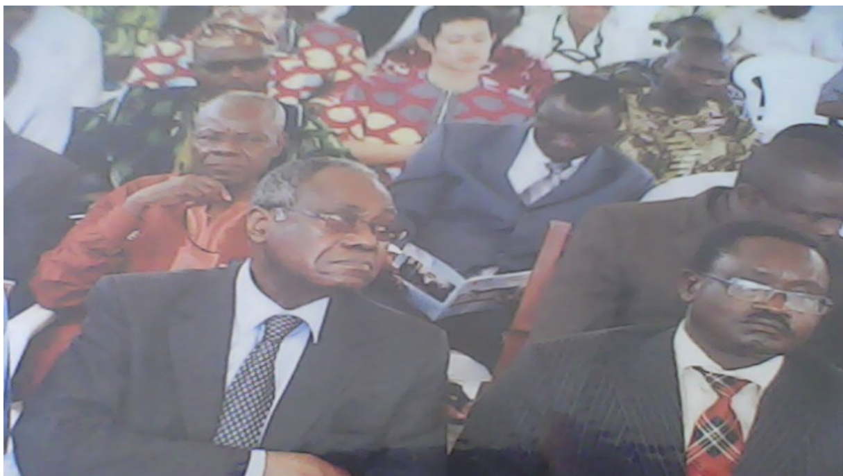
Le Haut Commissaire à la Gouvernance Concertée et le représentant du Médiateur de la République au lancement officiel

Les JOSCS 2010 ont été officiellement lancées le mercredi 20 octobre, journée nationale des Organisations de la Société Civile. La cérémonie officielle a été présidée par le Directeur de Cabinet du Ministère Chargé des Relation avec les Institutions. Plusieurs Autorités étaient présentes à cette cérémonie à savoir : le Haut Commissaire à la Gouvernance Concertée, le Vice Président du Conseil Economique et Social, le représentant du Médiateur de la République. Etaient également présents, les rois et sages de notre pays et les acteurs de la société civile.