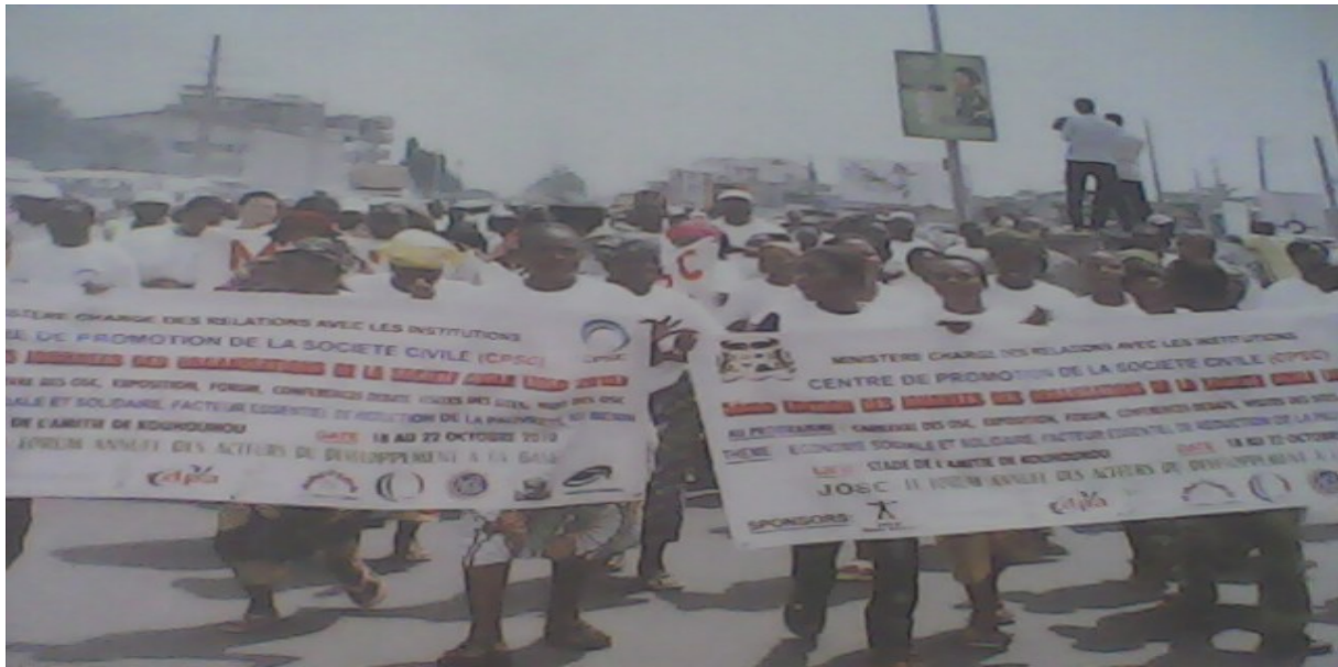
Le carnaval des OSC