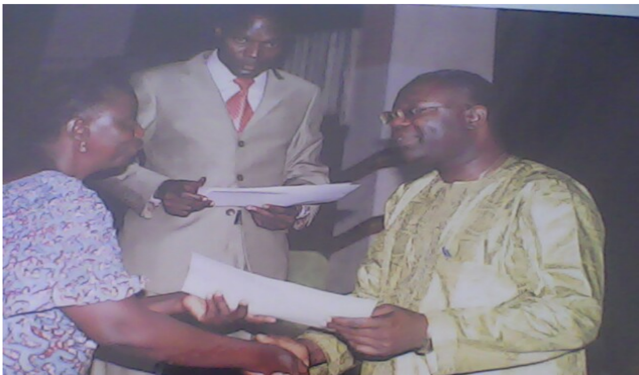
Nuit des OSC : Remise d'attestation de participation par Le Directeur de Cabinet du MCRI à une responsable d'OSC